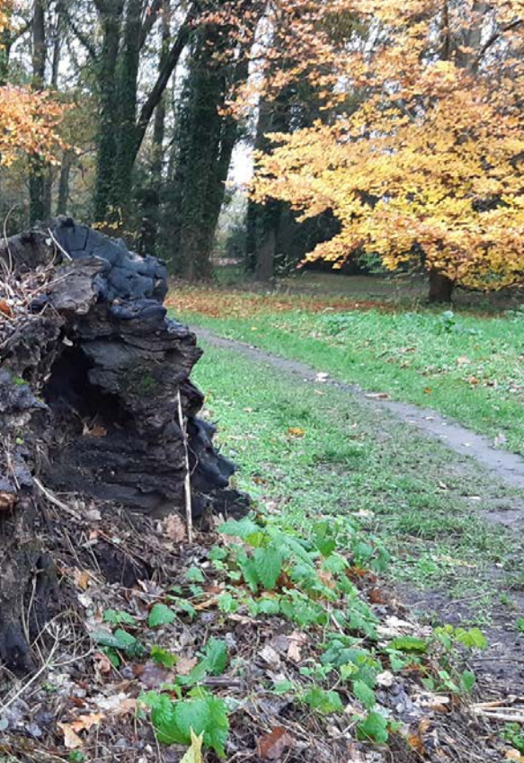
Le Marais de Cré présente une mosaïque de milieux humides : des prairies et leurs ourlets arbustifs, la ripisylve du Loir qui la traverse, et un boisement alluvial.