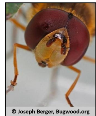
Figure 6 : Yeux composés, syrphé adulte

Une autre différence avec l'œil humain est que les insectes sont sensibles à des longueurs d'onde différentes (350 à 650 nm : proche UV à rouge). Leur perception des couleurs est donc différente de la nôtre. Cette technique est utilisée en protection des plantes via les pièges chromo-attractifs. La couleur du piège correspond aux longueurs d'onde auxquelles l'insecte est sensible. Il croit ainsi se diriger vers une plante (piège jaune pour les aleurodes par exemple).