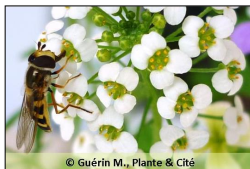
Figure 9 : Adulte de syrphes prélevant du nectar

L'introduction de plantes nectarifères adaptées à proximité des plantes à protéger, via des bandes fleuries ou des associations de cultures, permet d' attirer les adultes , de les maintenir sur le site et d' augmenter ainsi leur capacité de régulation des populations de pucerons .