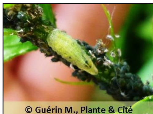
Figure 8 : Asticot de syrphes sur une colonie de pucerons

Le choix du lieu de ponte fait appel à d'autres critères puisqu'ils cherchent alors un lieu où de la nourriture sera disponible pour leur descendance, soit une plante infestée de pucerons. Ainsi, les plantes attirant les adultes qui cherchent à se nourrir ne seront pas forcément choisis par ceux-ci pour y pondre. La présence d'adultes sur une plante ne garantit donc pas la présence de larves auxiliaires sur ce même site . Le syrph ne déposera ces œufs sur une plante que si elle peut proposer une quantité de pucerons suffisante pour nourrir ses larves.