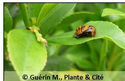
© Guérin M., Plante & Cité

Elle peut également fournir un véritable abri pour se protéger des conditions climatiques défavorables , ou des prédateurs . Beaucoup d'insectes se réfugient ainsi sous l'écorce de certains arbres ou dans des haies.