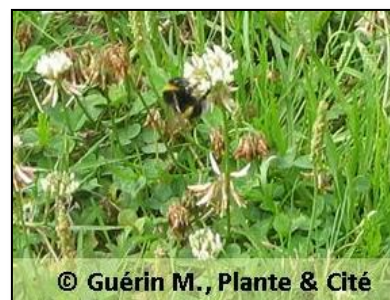
© Guérin M., Plante & Cité

L'insecte arrive sur la fleur pour se nourrir et va, à son insu ou activement, y récolter du pollen. Lors de sa recherche de nourriture, l'insecte va voler de plante en plante et ainsi disséminer le pollen. La spécificité de cette interaction dépend de la morphologie de la fleur, et de la nature du message chimique ou visuel utilisé.