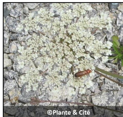
Figure 7 : Téléphore fauve sur ombelle de carotte